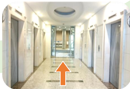
② エレベーターホール