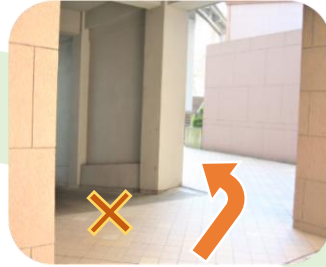
⑥⑦ 建物に沿って回る スロープは下りません。