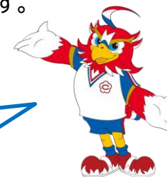
チューグル 【CHUKYO イーグルマスコットキャラクター】